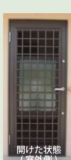
開けた状態 (室外側)