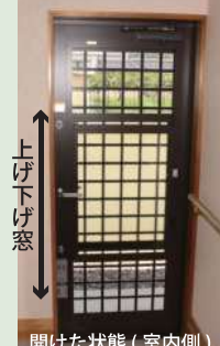
開けた状態 (室内側)